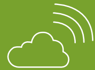
PLATE-FORME SÉCURISÉE PAS D'ÉQUIPEMENT DÉDIÉ